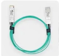
AOC Fiber Patch Cords